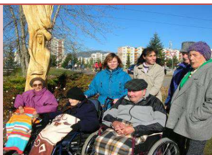
Vysvätenie sochy Zvestovanie