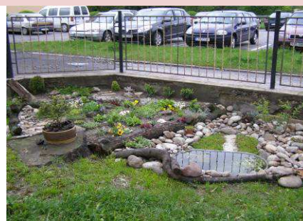
Záhradka v Útulku