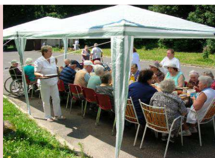
Posedenie pri guláši v lete