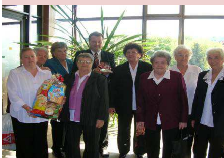
Domov domovu – Čadca