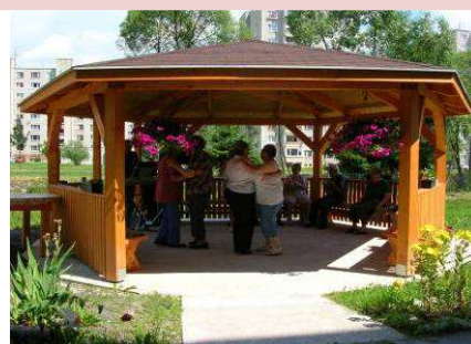
Tanečná zábava v altánku