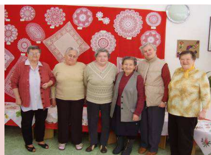
Výstava ručných prác