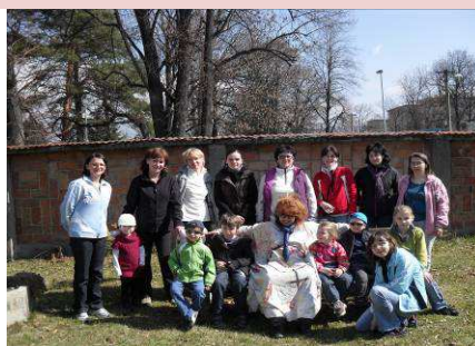
Deti a pracovníci Krízov. strediska