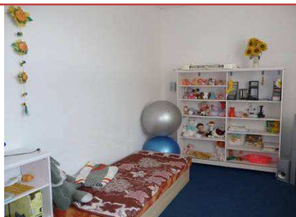
Krízové stredisko Pálkovo centrum