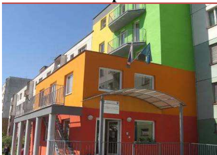
Zariadenie (ZpS a DSS)